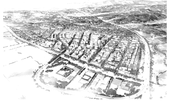
Planong Alvierra sa Hacienda Dolores ng Ayala Land

sa kalupaan ng Hacienda Dolores kung kaya inangkin ito ng LLL at FL at planong i-kumbert ng Ayala Land. Dagdag dito, plano ng Ayala Land ang proyektong Alvierra sa 1,000-ektarya ng Hacienda Dolores, habang Hacienda Luisita Economic Zone (eco-zone) ang plano ng pamilyang Cojuangco-Aquino sa halos 5,000-ektaryang lupa. Kinamkam na ng kanilang kumpanyang Tarlac Dev't Corp. (TADECO, na ilalim ng Jose Cojuangco and Sons, Inc.) ang mahigit 400-ektarya sa brgy. Balete at Cutcut. Ang mga proyektong ito ay isinusulong mismo ng gubyernong BS Aquino, sa ilalim ng programang Public-Private Partnership at W-Growth Corridor.